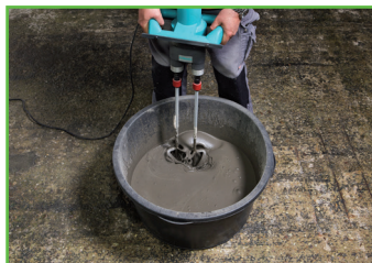
3. Met een geschikte menger minstens 3 Minuten intensief mengen