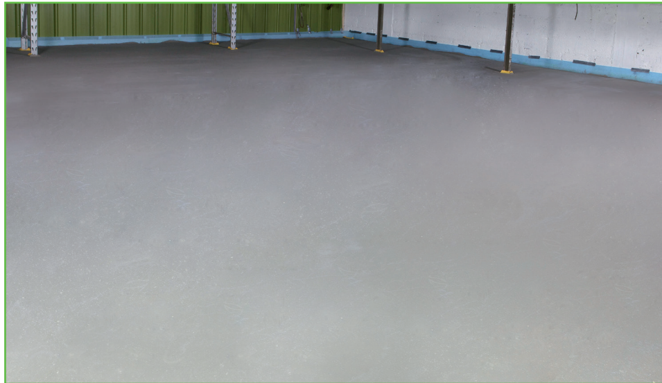
een sneldrogende en verwerkbare ondervloer, glad en strak!