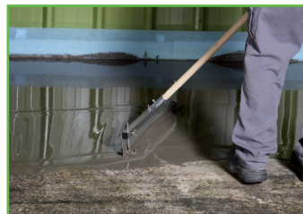
5. Op grotere vlakken verdelen met een kamspaan