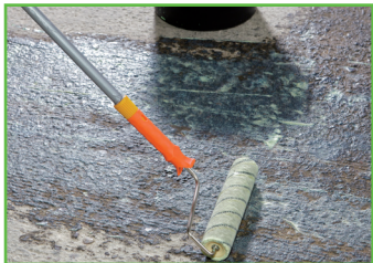
2. Grondering met KÖSTER SL Primer