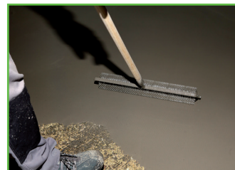
6. Afsluitend het materiaal met een stekelwals ontluften