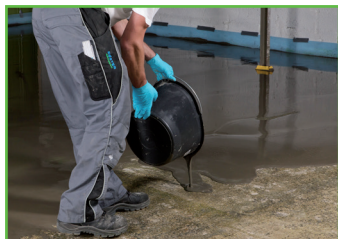
4. Direct na het mengen in de gewenste laagdikte verdelen